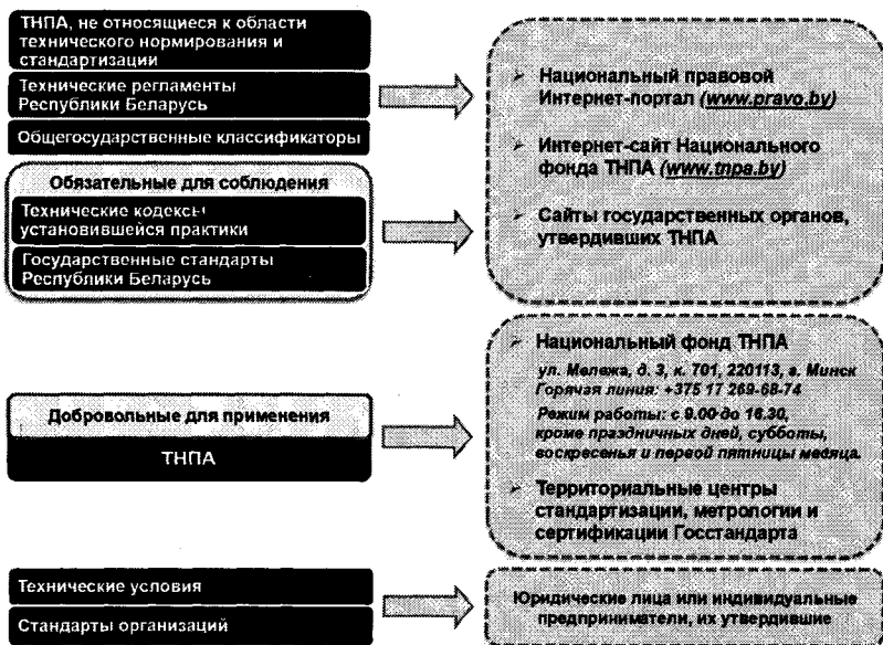
Рисунок 2 – Способы предоставления информации о ТНПА

Способы предоставления информации о ТНПА приведены на рисунке 2.